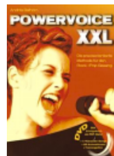
seit 2008 auch als DVD