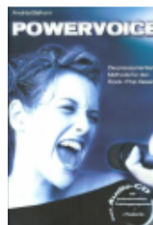
seit 2006 10, 11, 12, 13, 14